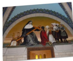
Peinture murale de la Basilique Ste Anne de Beaupré Cette belle peinture murale montre la Bienheureuse Marie de l'Incarnation en train d'enseigner aux Amérindiens ainsi qu'aux petites filles françaises.

La Ville de Québec unit ensemble des aspects de l'ancienne Europe et une touche moderne. Il y a la promenade sur la terrasse devant le Château Frontenac, un château qui ressemble à un hôtel, où des jongleurs de feu, des musiciens de jazz, des joueurs de cuillers and des violonistes jouent pour les touristes qui passent. A chaque coin, il y a un repère qui rappelle des personnes ou des