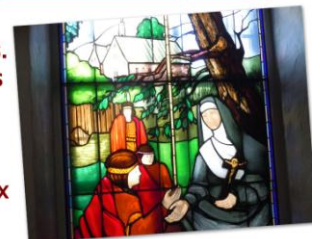
Vitrail de Marie et des enfants. La chapelle du Monastère des Ursulines est accessible au public. Ce vitrail se trouve dans la Chapelle et dépeint Marie en train d'enseigner aux enfants amérindiens.

événements importants, y compris un monument en hommage à toutes les religieuses qui ont exercé un apostolat dans la ville. Les Ursulines et les Augustines qui arrivèrent par le même navire en 1639 se trouvent en tête de liste.